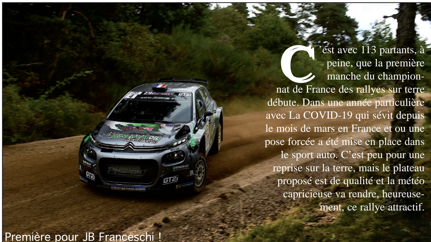
Première pour JB Franceschi !

Les 28, 29 & 30 août 2020 - National - Organisé par l'asa Lozère - 9e édition. Compte pour le championnat de France des rallyes sur terre 2020 Partants : 113 - Classés : 78 - Texte : Patrice Marin