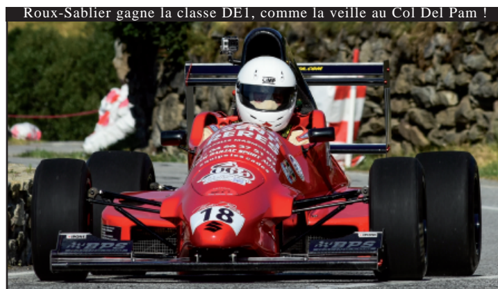
Roux-Sablir gagne la classe DE1, comme la veille au Col Del Pam !

ils sont 29 pilotes à passer la ligne d'arrivée.