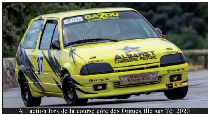
À l'action lors de la course côte des Orgues Ille sur Têt 2020 !