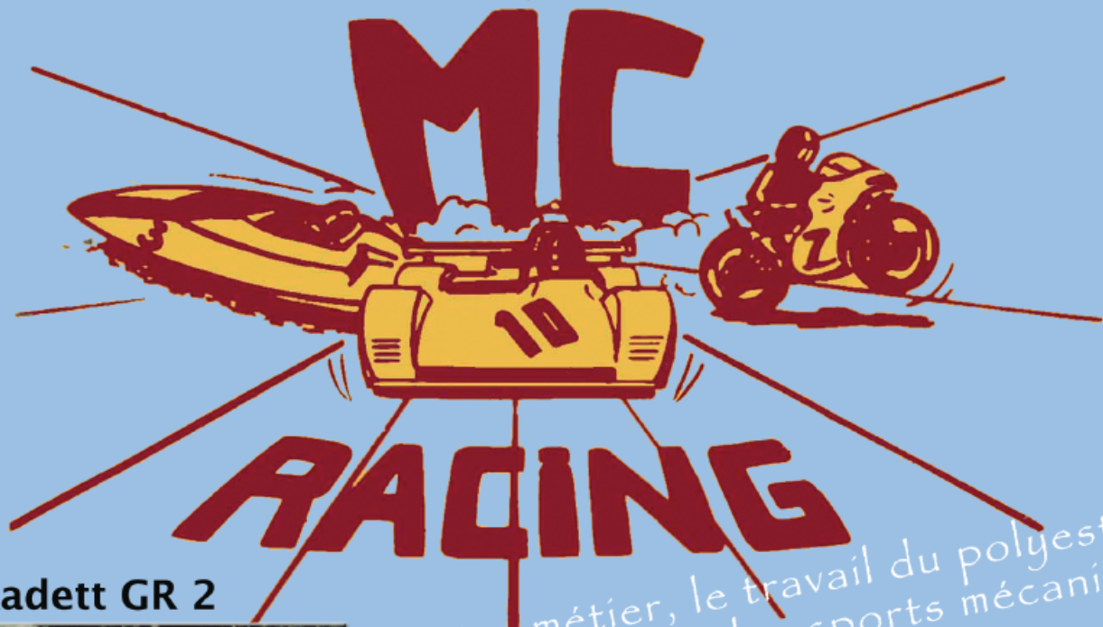
Opel Kadett GR 2