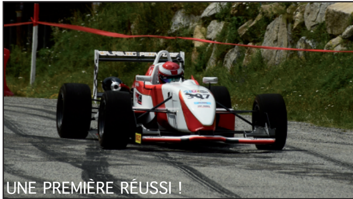
UNE PREMIÈRE RÉUSSI !

Compte pour le championnat de la Ligue Occitanie-Méditerranée 2020 et la Coupe de France de la Montagne 2021.