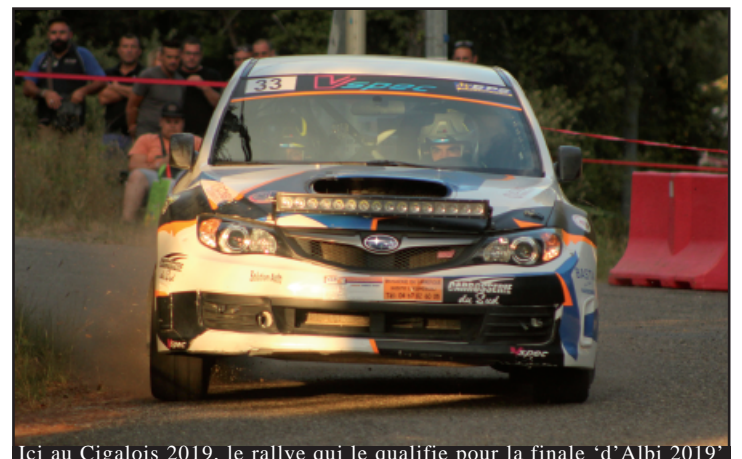
Ici au Cigalois 2019, le rallye qui le qualifie pour la finale 'd'Albi 2019'