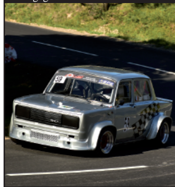
Marcillac débute la saison en fanfare dans la Ligue !