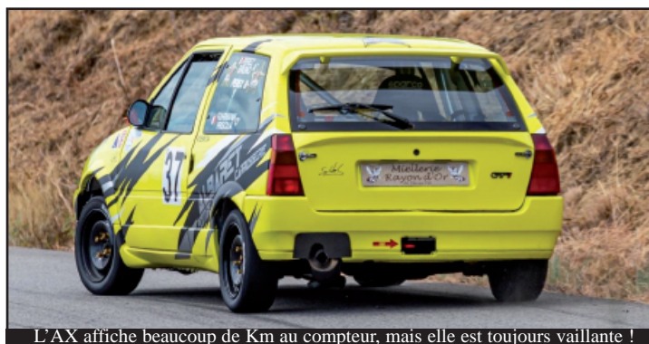
L'AX affiche beaucoup de Km au compteur, mais elle est toujours vaillante !

Plusieurs victoires de classe sont déjà a sont actif cette année. À l'image de la saison dernière !