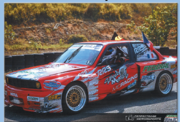
BMW E30 Style GR 5

GF2000 / VHC Vitre polycarbonate Rampe de phare Antibrouillards