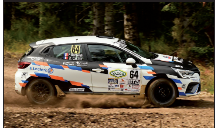
Bernardi rentre deuxième des deux roues motrices avec la nouvelle Clio 5 !