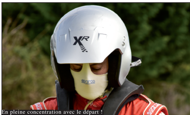
En pleine concentration avec le départ !

même été championne de France des rallyes.