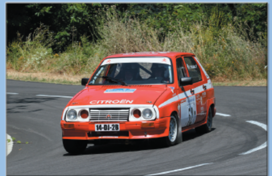
Visa 1000 pistes

Notre métier, le travail du polyester Notre passion, les sports mécaniques