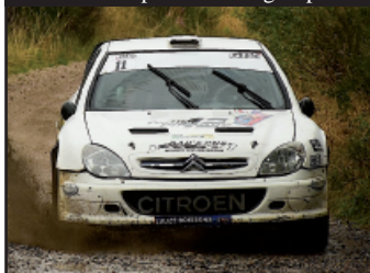
Rousset s'impose dans le groupe A !