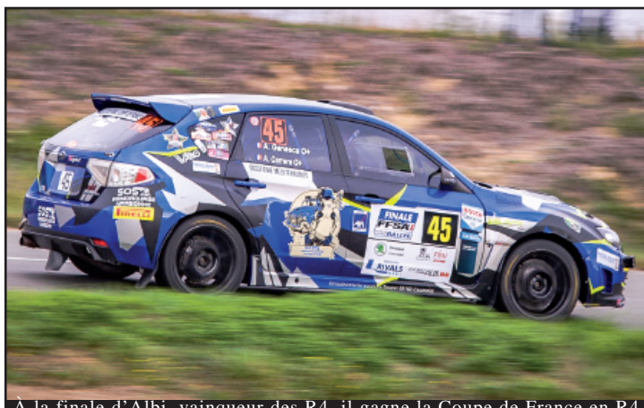
A la finale d'Albi, vainqueur des R4, il gagne la Coupe de France en R4