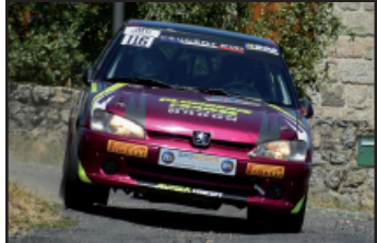
Delorme gagne la classe A6 !

A6 : Belle course d'Adrien Delorme qui monte sur la troisième marche du podium en plus de gagner cette classe. Frédéric Bouilhol monte sur le podium