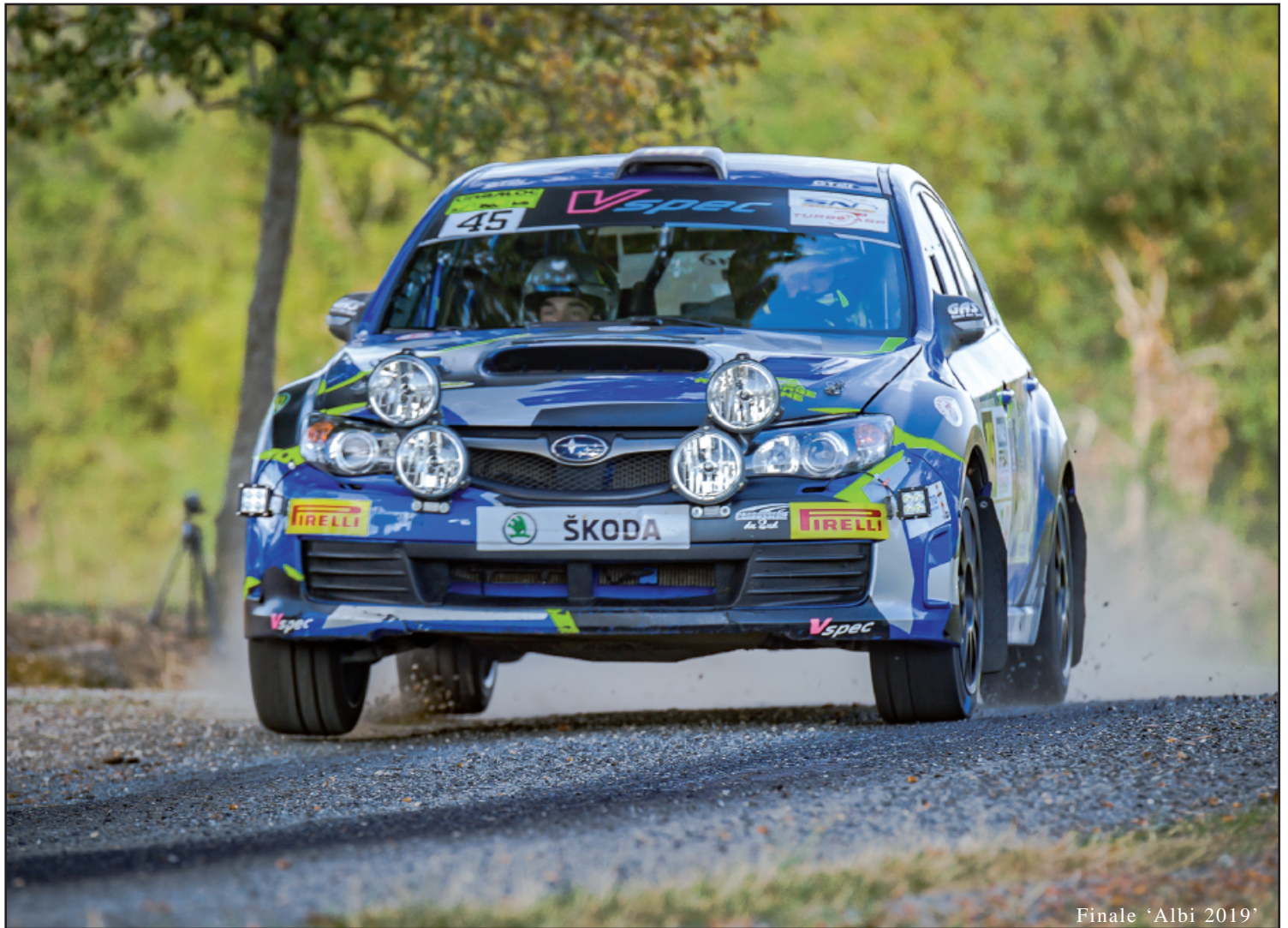
Finale 'Albi 2019'