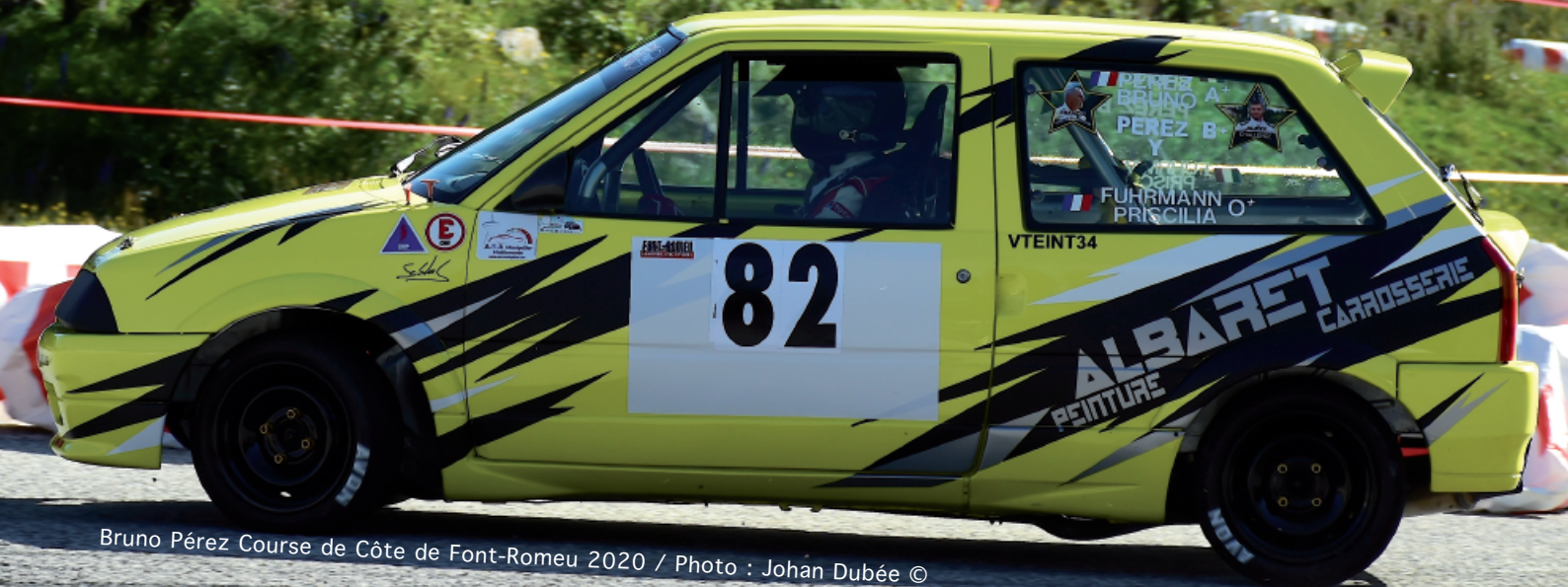
Bruno Pérez Course de Côte de Font-Romeu 2020