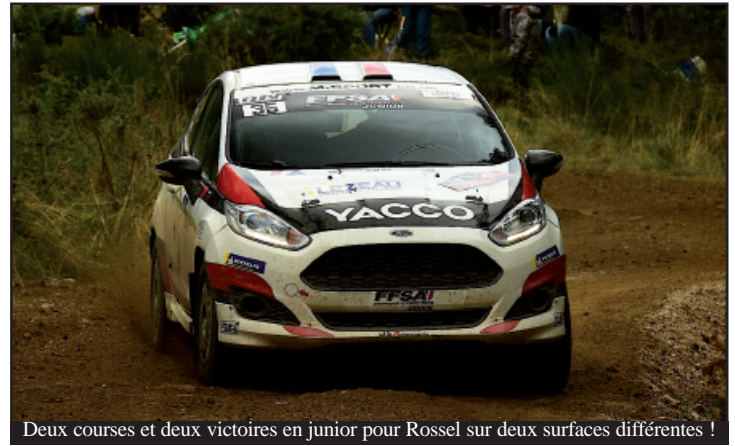
Deux courses et deux victoires en junior pour Rossel sur deux surfaces différentes !

Thibault Durbec, troisième : "Aujourd'hui nous avons été