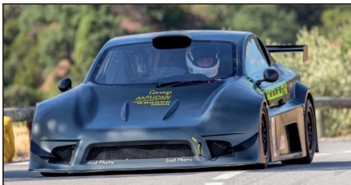
Jacquot collectionne les belles perf depuis le début de la saison, ici au Orgues !

Course de Côte de Neffîès : Les 07 & 08 2020 - Régionale - 28e édition Organisé par l'asac Montpellier Pic-Saint-Loup Partants : 52 - Classés : 50 / Texte: Patrice Marin - Photos Johan Dubée © Compte pour le championnat de la Ligue Occitanie-Méditerranée 2020 et la Coupe de France de la Montagne 2021.