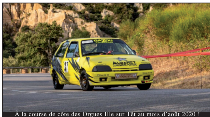
À la course de côte des Orgues Ille sur Têt au mois d'août 2020 !