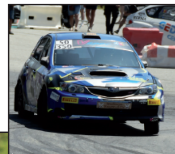
A la course de côte de Font Romeu 2020

Pour le confinement avec mon travail de dépanneur remorqueur et fourrieriste, mon activité a baissé mais on a quand même bien bosser. Pour