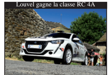
Louvel gagne la classe RC 4A