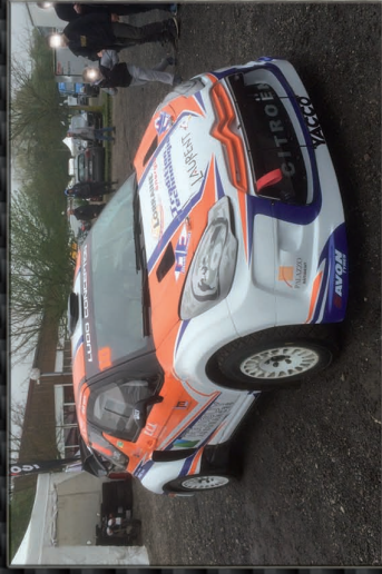
Citroën DS3 - F2000