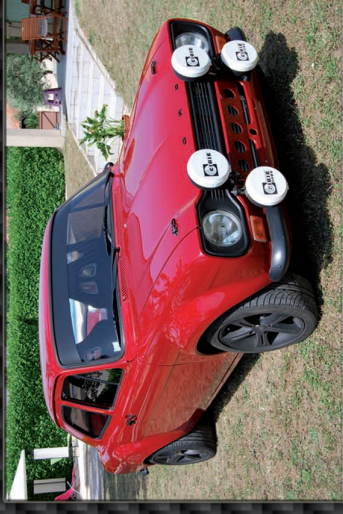
Ford Escort / Phase 1 - Groupe 2